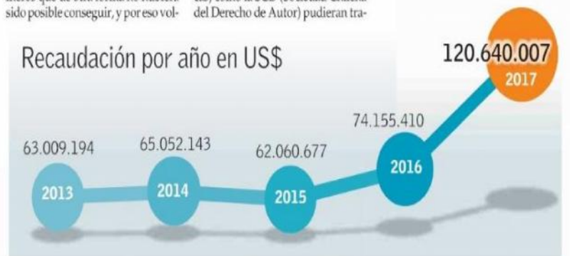
Recaudación por año en US$

Acerca del precio de los boletos, que el año pasado llegaron a un costo promedio de $55 mil, el productor sostiene que esta cifra no difiere del resto de los países de la región. "Pero sí el chileno paga un precio más alto por estar mejor ubicado. Una entrada promedio en Chile no es muy distinta a una entrada promedio en Europa", cuenta, y detalla los factores que inciden en su costo, como el 19% por el pago del IVA, el 5% que corresponde a la SCD, el 56% perteneciente a los gastos del artista y los impuestos asociados, además de un 7% adicional de impuestos si el concierto se realiza en el Estadio Nacional.